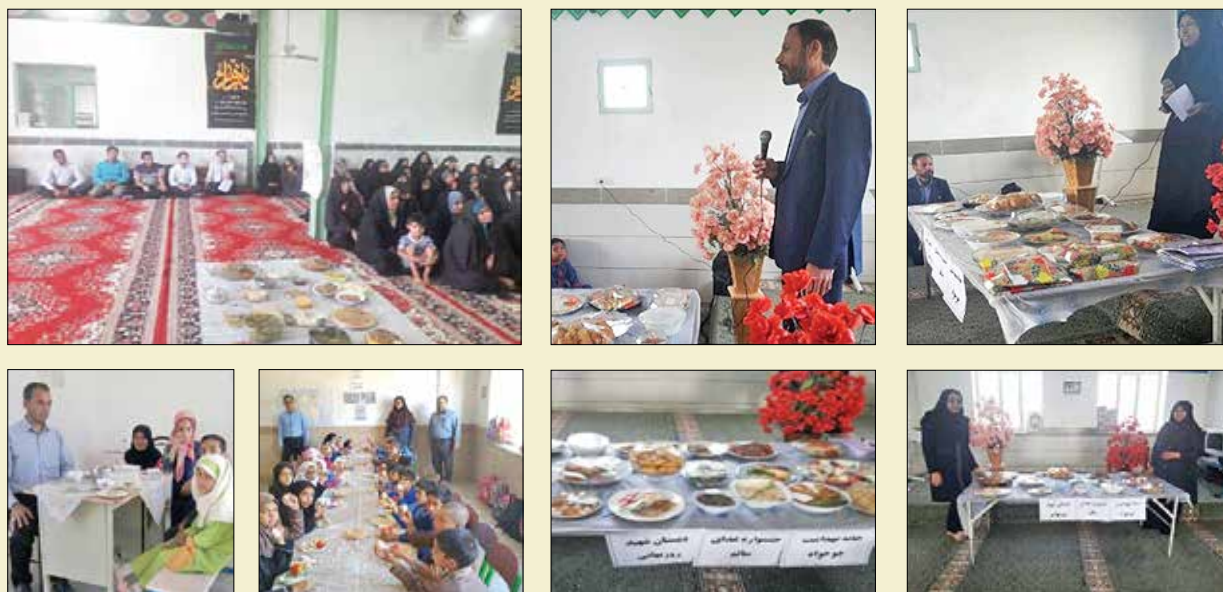
برگزاری جشنواره غذا به همت بهورزان خانه‌های بهداشت شهرستان طبس به مناسبت روز جهانی غذا (۲۴ مهر ۹۷)

طناب‌کشی و مسابقات ورزشی در مدارس، برگزاری مسابقه نقاشی در بین مدارس ابتدایی و اهدای جوایز به نفرات برتر، برگزاری جلسات آموزشی در خصوص شعار سال برای سفیران سلامت خانوار و دانش‌آموز با همکاری کارشناسان که سفیران سلامت خانوار و سفیران سلامت دانش‌آموز و تعدادی از کارکنان مدارس آموزش‌های لازم را فرا گرفتند و همچنین اطلاع‌رسانی جهت تشکیل پرونده الکترونیک و انجام معاینات به عمل آمد.