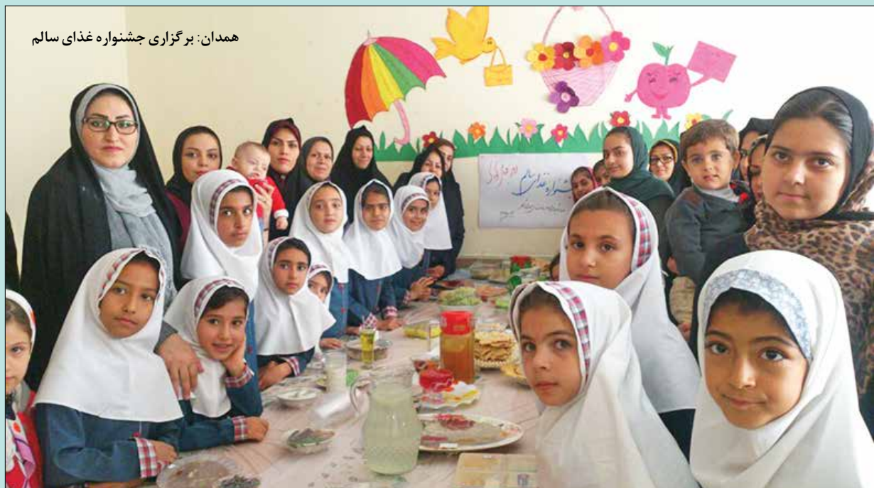
همدان: برگزاری جشنواره غذای سالم

ایران: بهسازی کامل ساختمان خانه بهداشت با تخریب بازسازی و اضافه نمودن فضای سرایداری و رنگ آمیزی کل ساختمان، اجاره یک مکان ۲۰۰ متری و تجهیز آن به وسایل ورزشی جهت استفاده ورزشی برای بانوان روستا، پیشنهاد و انجام بهسازی و سنگ فرش مسیر روستا تا مدرسه جهت ایمن بودن دانش‌آموزان و استفاده جهت مسیر پیاده روی مردم روستا، برگزاری اولین نمایشگاه و جشنواره بومی محلی در سطح شهرستان رباط کریم (جشنواره غذا، هنرهای نمایشی، بازی‌های محلی)، پیشنهاد و انجام تخریب کامل و بازسازی کامل سرویس بهداشتی دانش‌آموزان مدرسه ابتدایی تدبیر به صورت کاملاً بهداشتی، با توجه به اهمیت ید و ثقلب بعضی تولیدکننده‌ها در تهیه نمک فاقد ید در بسته‌های نمک یددار، جلب مشارکت هزینه خرید کیت‌های یدسنجی به تعداد تمام اماکن توزیع کننده نمک خوراکی روستا، تجهیز اتاق معاینه زنان