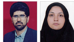
ترتیب نویسندگان از راست به چپ