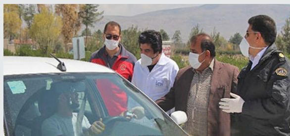
انجام طرح فاصله گذاری اجتماعی با حضور فرماندار مرودشت و بهورز خانه بهداشت حاجی آباد