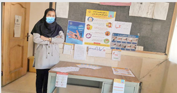
* ایجاد ایستگاه های آموزشی بیماری کرونا در خانه های بهداشت (اقلید)