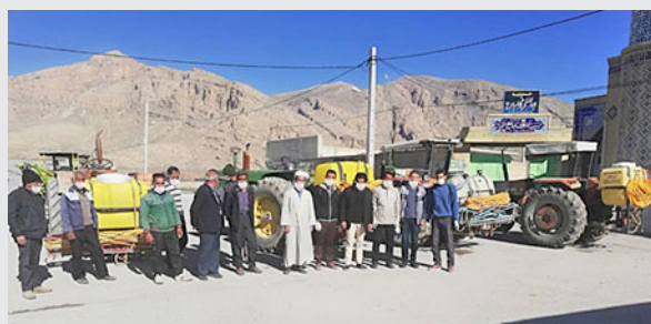
* همراهی بهورز با مردم در گندزدایی روستا و جلب مشارکت مردمی خانه بهداشت حاجی آباد ( مرودشت )