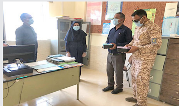
* تقدیر از بهورزان در راستای پیشگیری از بیماری کرونا توسط دهیار و رئیس بسیج منطقه روستای دولت آباد (فراشبند)