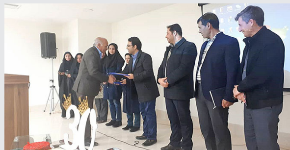
* برگزاری مراسم تقدیر و تشکر از بهورزان به مناسبت بازنشستگی همکاران بهورز (اقلید)