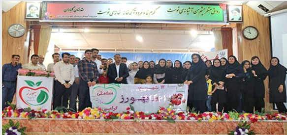
* برگزاری مراسم روز بهروز، تقدیر و اهدای جوایز (فراشبند)