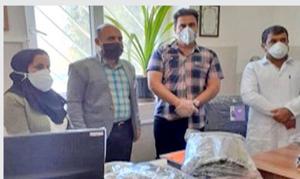
* جلب مشارکت مردمی و اهدای دستکش و ماسک برای مردم روستا توسط بهورز خانه بهداشت جهادآباد (فیروزآباد)