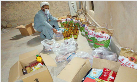
* فعالیت بهورزان در هفته سلامت ۱۳۹۹ در راستای حمایت از خانوارهای بی بضاعت