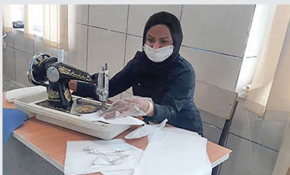
* کمک به تهیه ماسک در روستای مادوان شهرستان داراب