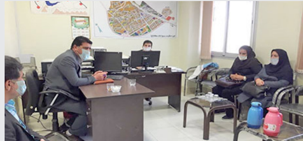
* شرکت مربیان بهورزی در جلسه شورا و دهیارهای روستاهای (اقلید)