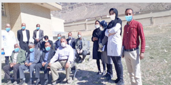
تشکیل ستاد مبارزه با کرونا با معتمدان و بزرگان توسط بهورز روستای شهرک ابرج ( مرودشت )