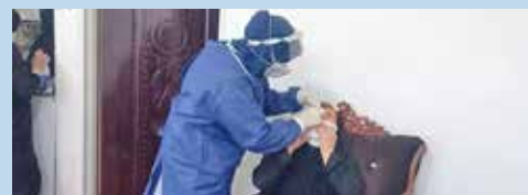
انجام رپید تست توسط بهورزخانه بهداشت ازنهری از شهرستان نهاوند