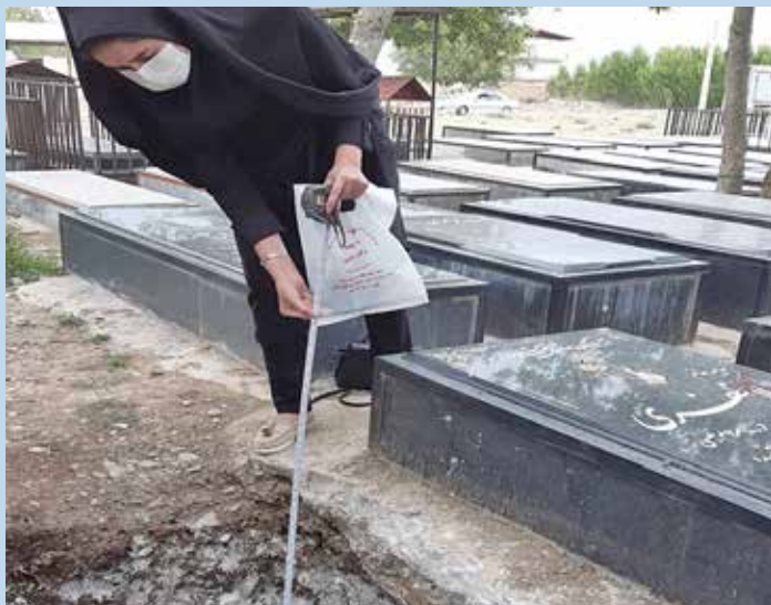
نظارت بر دفن بیمار کرونایی از شهرستان نهاوند

ایجاد تمهیدات لازم برای الکترونیکی کردن آزمون فصلنامه بهورز و شرکت بهورزان دانشگاه همدان در آزمون فصلنامه بهورز بهار ۱۴۰۰ به شکل الکترونیکی