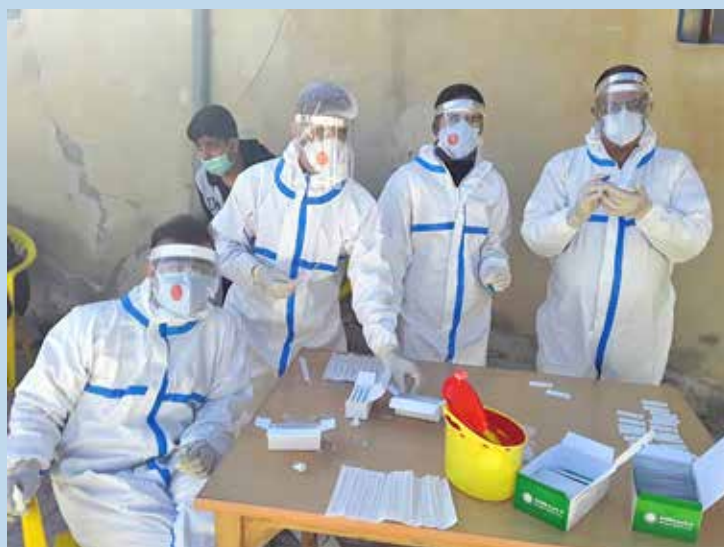
انجام رپید تست توسط بهورزان در مرکز سلامت کوهانی از شهرستان نهاوند