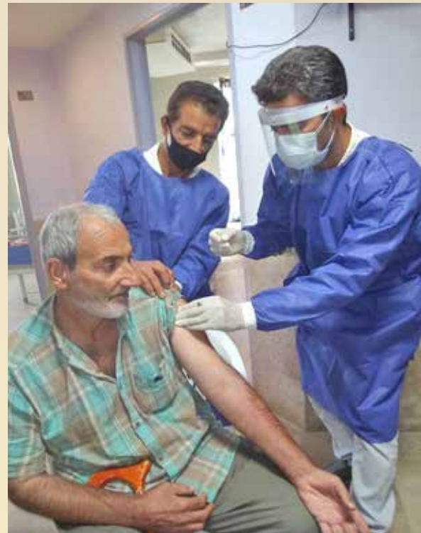
واکسیناسیون انفلوانزا خانه سالمندان