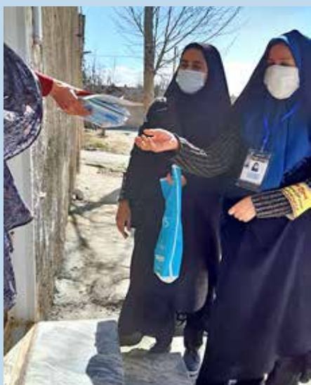
توزیع ماسک و مواد ضد عفونی برای خانواده‌های مبتلایان به کرونا