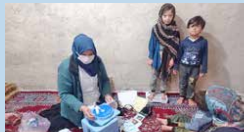
مراقبت بهورزخانه بهداشت ازنهری از شهرستان نهاوند