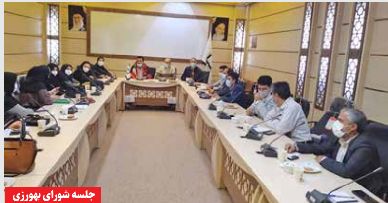
جلسه شورای بهوزی

دانشجویان به میزان ۲۰۴ ساعت (۲ واحد کارآموزی) و اجرای آن مطابق برنامه ● ثبت نام ۱۴ نفر از پذیرفته شدگان گزینش بهوزی با مدرک دانشگاهی مرتبط و تدوین برنامه ۴ ماهه آموزش تئوری عملی اولین دوره تطبیقی در دانشکده تربت جام برای شروع آموزشها ● برگزاری جلسه شورای بهوزی دانشکده با حضور معاونت محترم بهداشتی و سایر مسؤولان که از دستاورد مهم این جلسه می توان به بهبود فرآیند رفع مشکلات تاسیساتی خانه های بهداشت اشاره کرد.