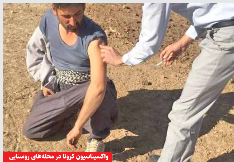
واکسیناسیون کرونا در محله های روستایی