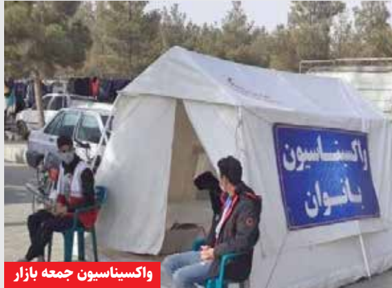
واکسیناسیون جمعه بازار