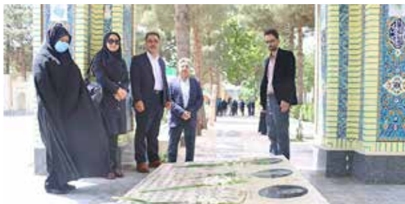
شرکت مدیر و مربیان مرکز آموزش بهورزی در مراسم غبارروبی مزار شهدا در هفته سلامت