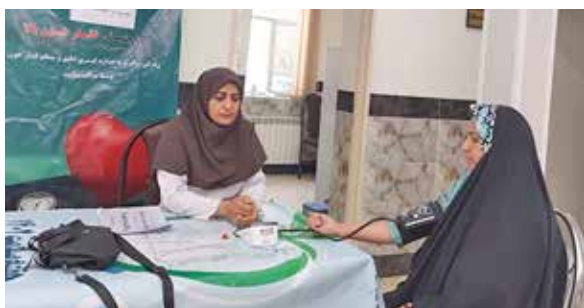
شبکه بهداشت و درمان پیشوا: آموزش چهره به چهره و اندازه گیری فشارخون و آموزش نحوه استفاده از دستگاه، در خانه های بهداشت تحت پوشش توسط بهورزان به مناسبت هفته فشارخون