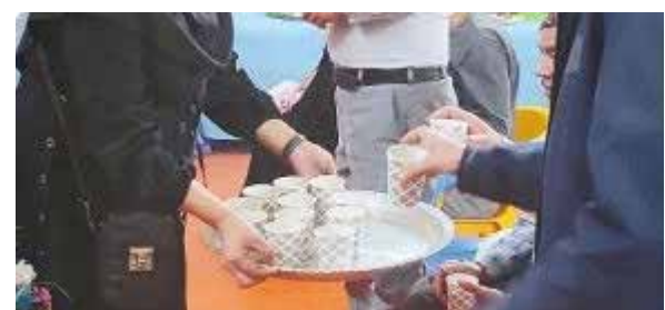
برگزاری جشنواره غذای سالم توسط بهورزان بخش گل تپه در مرکز خدمات جامع سلامت گل تپه