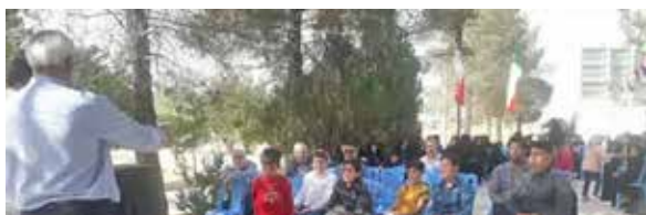
برگزاری پیاده روی و صرف صبحانه سالم در روستای پوده شهرستان دهاقان جهت عموم مردم به مناسبت هفته بدون دخانیات با همکاری شورا و دهیاری روستا