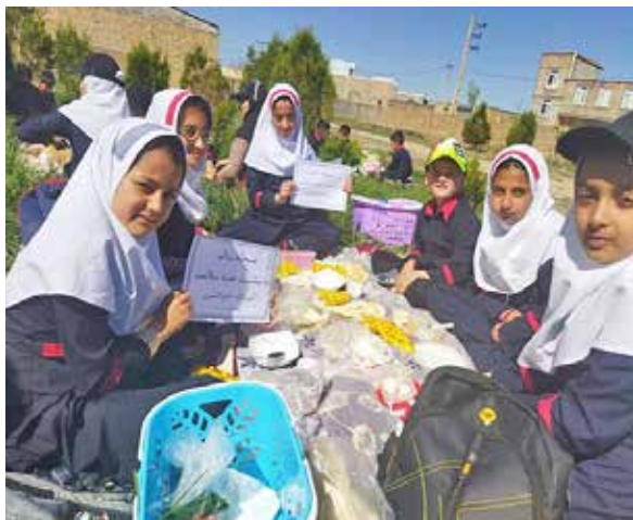
تغذیه سالم و اهمیت مصرف مکمل در شهرستان سلطانیه