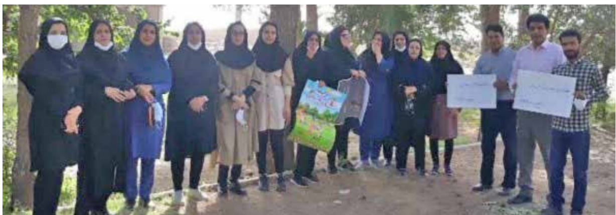
برگزاری مراسم پیاده روی توسط بهورزان و پرسنل تحت پوشش مرکز خدمات جامع سلامت هرمزآباد به مناسبت هفته سلامت