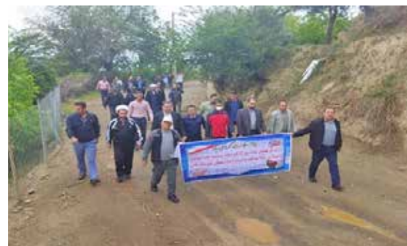
همایش پیاده روی و صبحانه سالم کارکنان شبکه بهداشت به مناسبت هفته سلامت شهرستان طارم

برگزاری همایش پیاده روی و تهیه غذای سالم به مناسبت هفته سلامت جهت عموم مردم، داوطلبان سلامت و کارکنان مراکز بهداشت که در این مراسم شرکت کنندگان با استفاده از مواد در دسترس و مغذی و با تهیه غذاهای محلی در جشنواره شرکت نموده و در پایان برنامه به نفرات برتر جوایزی توسط معاونت بهداشت اهدا شد.