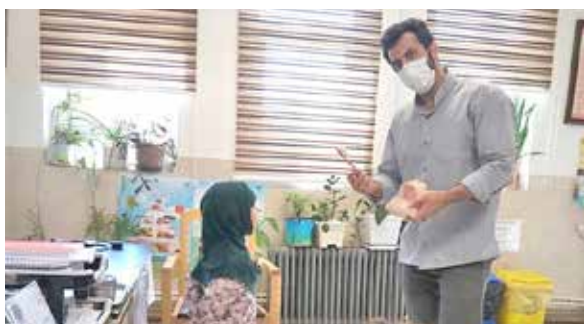
آموزش نحوه استفاده از مسواک و نخ دندان