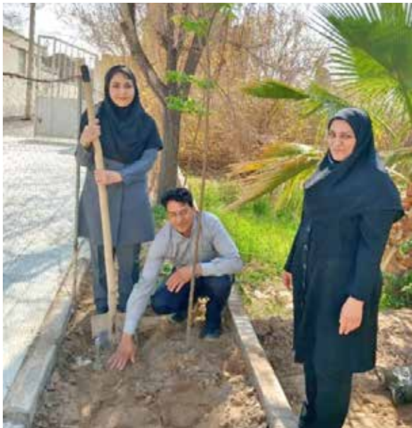
سبزیکاری و گلکاری در خانه بهداشت همت‌آبادآگاه توسط بهورزان