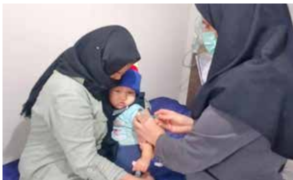
تزریق واکسن مرحله تکمیلی MR و فلج اطفال افغانه در شبکه بهداشت و درمان فیروزکوه