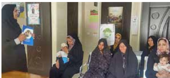
آموزش به مناسبت هفته بدون دخانیات در خانه بهداشت محمودآباد شهرستان دهاقان