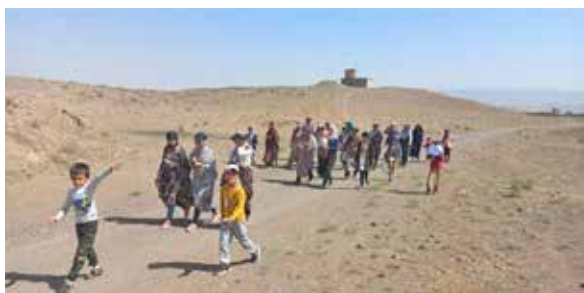
اجرای برنامه پیاده روی خانوادگی به مناسبت هفته ملی بدون دخانیات با همکاری بهورزان خانه بهداشت روستای فرخار