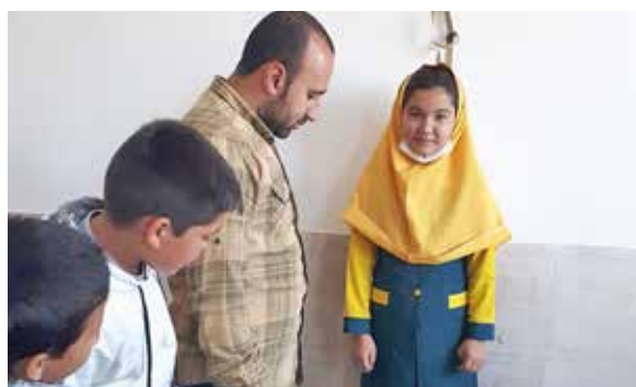
انجام معاینات غربالگری پدیکولوزیس و معاینات دانش آموزی در مدرسه یاداوران قلعه نو جامکاران توسط بهورزان خانه بهداشت