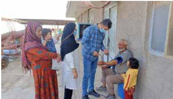
ارایه خدمات بهداشتی درمانی توسط تیم سلامت به روستاییان مناطق سیاری تحت پوشش مرکز خدمات جامع سلامت تدبیر شهرستان گرمسار