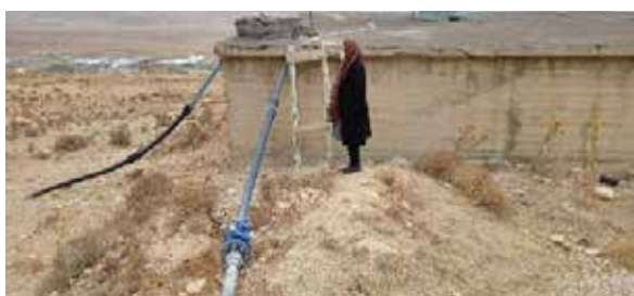
بازدید از مراکز تهیه و توزیع مواد غذایی و مخازن آب روستا