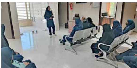
برگزاری کلاس آموزشی پیشگیری از سالک در خانه بهداشت پوده شهرستان دهاقان