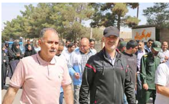
همایش پیاده روی به مناسبت هفته سلامت

برگزاری جلسه شورای بهورزی دانشکده در محل تفرجگاه روستای بزد و تجلیل از بهورزان بازنشسته که طی این مراسم مشکلات خانه‌های بهداشت و مسایل رفاهی بهورزان مورد بررسی قرار گرفت و به سوالات نمایندگان پاسخ و تصمیمات لازم نیز اتخاذ شد.