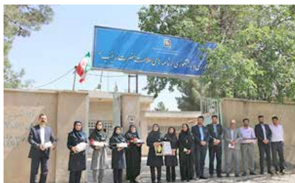
حضور مسئولان و مربیان بهورزی در روز معلم