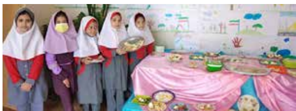
برگزاری جشنواره غذا در مدارس روستا توسط بهورزان شهرستان دهاقان