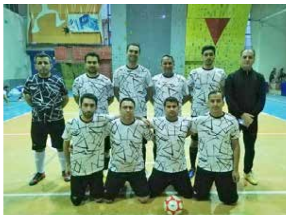
● حضور بهورزان در تیم فوتسال در مسابقات جام فجر شهرستان درگز