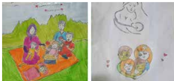
برگزاری مسابقات نقاشی به مناسبت هفته جمعیت در خانه بهداشت ارجنک شهرستان خوانسار