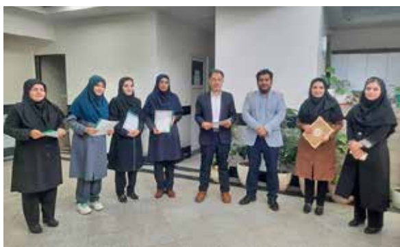
تقدیر از مربیان مرکز آموزش بهورزی توسط مدیر شبکه بهداشت و درمان فیروزه به مناسبت روز معلم، با حضور در آموزشگاه بهورزی با اهدای لوح سپاس