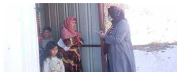
مراقبت های در منزل مادر باردار