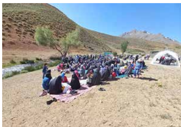
برگزاری همایش پیاده روی خانوادگی توسط تیم سلامت مرکز خدمات جامع سلامت روستایی آغچه به مناسبت هفته ملی سلامت شهرستان بوئین و میاندشت