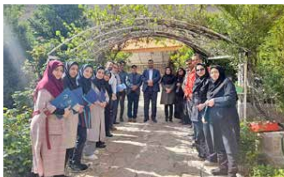
برگزاری مراسم گرامیداشت روز معلم در روستای بسیار زیبای بار با حضور صمیمانه معاون بهداشت دانشگاه و اهدای لوح تقدیر