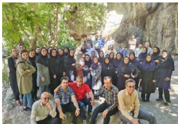
● حضور بهورزان در برنامه تفریحی شهرستان درگز