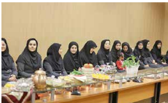
مسابقه تغذیه سالم با مواد غذایی در دسترس به مناسبت هفته سلامت در شهرستان زنجان

اولیه بهداشتی و انتخابات نمایندگان شورای بهورزی شهرستان‌ها در سطح مرکز بهداشت استان با حضور جمعی از مدیران و نمایندگان بهورزان که در این جلسه به مشکلات بیان شده از طرف بهورزان رسیدگی شد.