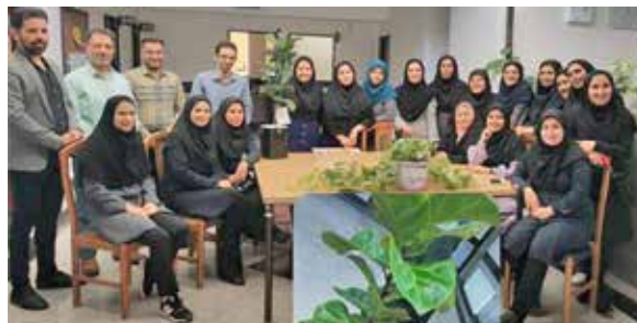
تقدیر از دانشجویان دوره تطبیقی کارشناسی بهورزی ورودی ۱۴۰۱ و فارغ‌التحصیلان کاردانی حضوری ورودی ۱۴۰۰ و ارسال گل به مناسبت روز معلم