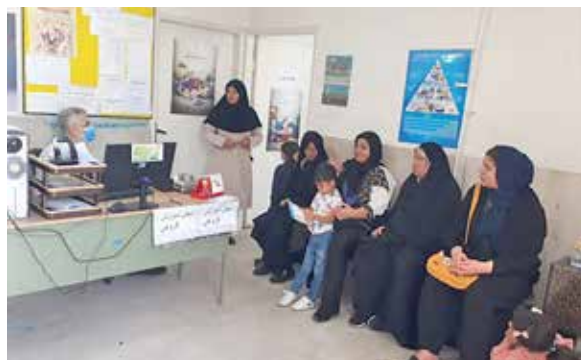
آموزش جوانی جمعیت با موضوع سرمایه های زندگی با حضور پزشک و بهورز خانه بهداشت قلعه نو جامکاران