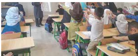
آموزش حرکات کششی در مدارس خانه بهداشت محمودآباد