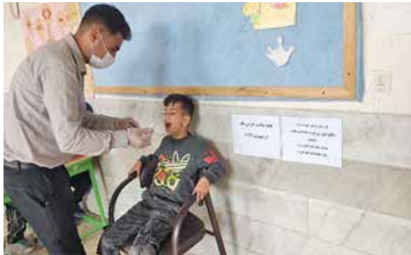
انجام و آموزش مراقبت‌های بهداشت دهان و دندان و وارنیش تراپی در شهرستان سلطانیه