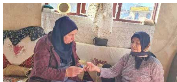
مراقبت های دوره ای و آموزش به سالمندان

• مشارکت فعال بهورزان جهت تله گذاری در بیماریابی سالک همچنین طرح غربالگری دیابت در جمعیت بالای ۳۰ سال تحت پوشش در کلیه خانه های بهداشت شبکه بهداشت و درمان شهرستان ورامین • نمونه گیری مالاریا از مهاجران غیر ایرانی وارده به روستا توسط بهورز خانه بهداشت قشلاق جلیل آباد شهرستان ورامین