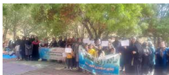
اجرای برنامه پیاده‌روی داوطلبان و سفیران سلامت تحت پوشش مرکز خدمات جامع سلامت کلاته رودبار شهرستان دامغان