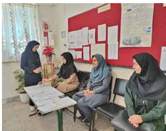
مراقبت کارکنان مدارس روستا توسط بهورزان به مناسبت روز معلم شهرستان دهاقان