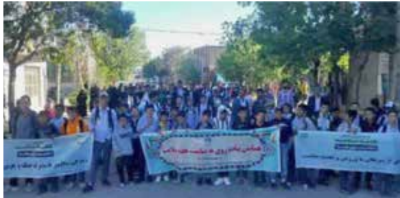
برگزاری همایش پیاده روی هفته سلامت در روستای یکن آباد از شهرستان همدان و توزیع صبحانه سالم و اهدای جوایز