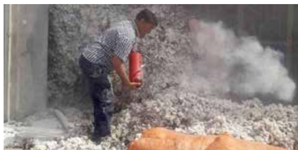
پیرو ایجاد حریق در یکی از منازل روستای اردمه نیشابور، بهورزان پرتلاش خانه بهداشت اردمه بازهم با تلاش خود حریق را مهار کردند.