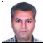
جماقلیح سطلانی قره شور بهورز خانه بهداشت قره شور