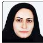
اعظم قربانی سینی