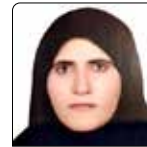
گبری اریک بهورز خانه بهداشت ضمیمه کوزران