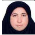
شریغه امین الهی بهورز خانه بهداشت کرمون