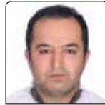
ضیاء پرتوی پاککیاده بهورز خانه بهداشت بالا پاککیاده