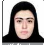
اروین جهانی ینگی گندی