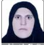
نازملک شهبه بخش