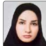
اختر بالنده مراقب سلامت قصرشیرین