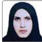
صغری غنی بهورز خانه بهداشت پچک