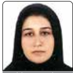
هما چیت سازان