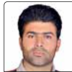
آزاد نظریان بهورز خانه بهداشت شیخ صله