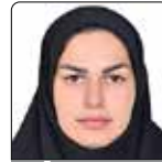
زینت ایمانی ایمن آبادی بهورز خانه بهداشت سده