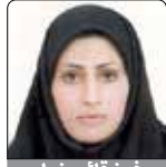
فرخ قائم خواه