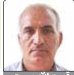
قدرت الله دوستی