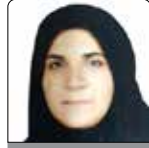
زهره پیر بهورز خانه بهداشت بهده