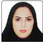
شکوفه بندش بهورز خانه بهداشت بیراقوند