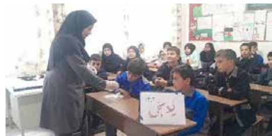
جلسه آموزش برنامه یدسنجی در مدارس