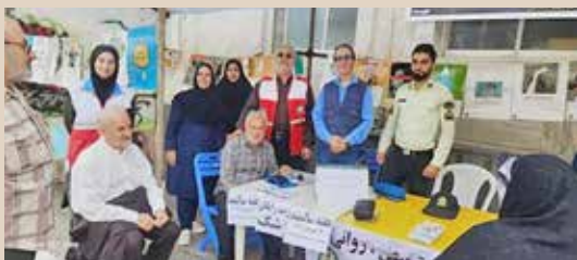
ويزيت رایگان پزشک به مناسبت هفته سالمندان