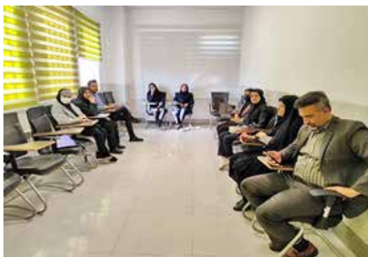
شروع دومین دوره تطبیقی مرکز آموزش بهورزی شهرستان بردسیر