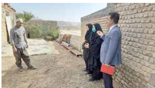
انجام پیگیری‌های مادران باردار درب منزل توسط بهورز، کارشناس ناظر و ماما