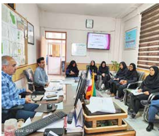
برگزاری کمیته پویش ملی و هفته جهانی ایدز در شهرستان بردسیر