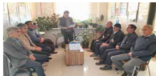
کارگاه آموزشی هفته ملی دیابت توسط بهورزان و مراقبان سلامت