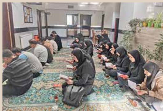
زیارت عاشورا در آموزشگاه بهورزی