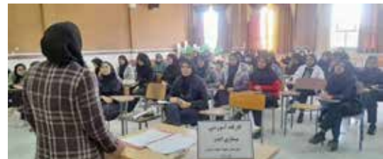
اجرای برنامه پویش ملی بیماری ایدز و سرطان توسط بهورزان و مراقبان سلامت