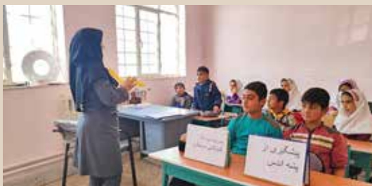
جلسه آشنایی با پشه آئدس