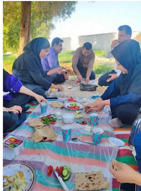
برگزاری اردوی توجیهی تفریحی فراگیران کاردانی بهورز عشایر