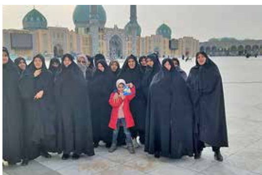
برگزاری اردوی زیارتی قم و جمکران ویژه رابطان پایگاه سلامت نوابی و شمس آبادی قمصر