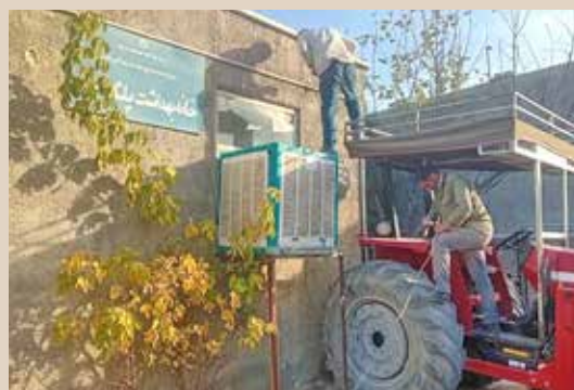
محوطه سازی و باز سازی خانه بهداشت روستای پلگرد شهرستان درگز با مشارکت دهیاری و شورای اسلامی روستا و بهمت حامد آراسته بهورز روستا