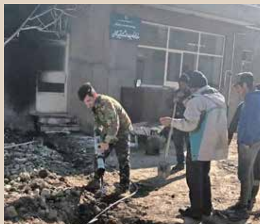
تعمیرخانه بهداشت تیرگان با مشارکت خیران سلامت و بهمت‌های حمید بهورز شهرستان درگز