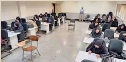
برگزاري آزمون جامع پزشكان، كارشناسان بهداشت محيط و كار، بهورزان و مراقبان سلامت توسط مركز آموزش بهورزي و بازآموزي برنامه‌هاي سلامت شهرستان‌هاي سمنان و دامغان