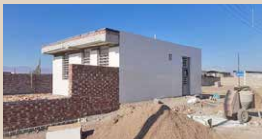
احداث پایگاه بهداشتی ارجمنده توسط خیران سلامت شهرستان زرنند