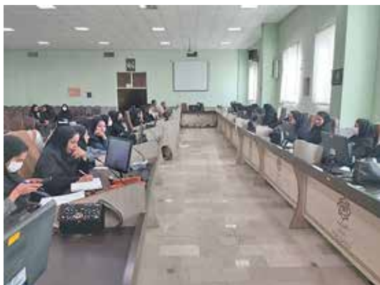
آموزش کارکنان تیم سلامت شهرستان بافت