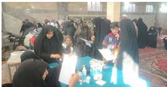
کنترل و اندازه‌گیری فشارخون و قند خون و آموزش طب سنتی در مراسم نماز جمعه روستای آزران