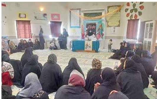
آموزش خودآزمایی پستان و عوامل خطر سرطان پستان در مساجد شهرستان سرخس