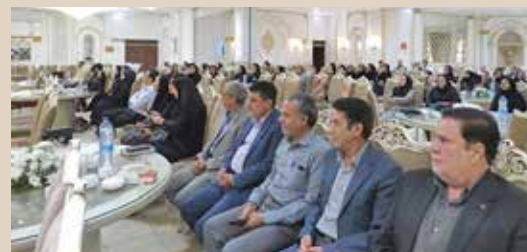
برگزاری جشن گرامیداشت روز بهورز در شهرستان‌های تحت پوشش دانشگاه