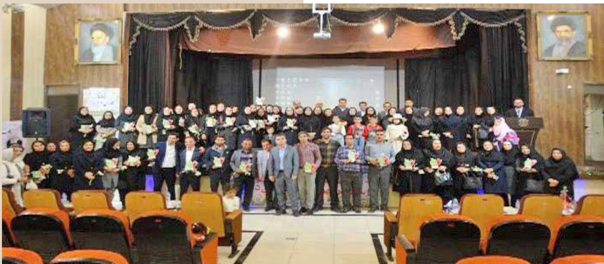
مراسم تجلیل و تقدیر از بهورزان بازنشسته شهرستان‌های کازرون و مرودشت