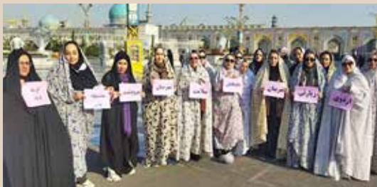
برگزاری اردوی زیارتی مربیان داوطلبان سلامت شهرستان مرودشت به مناسبت روز جهانی داوطلب با شعار «تاثیر کوچک، تغییر بزرگ با داوطلبان سلامت»