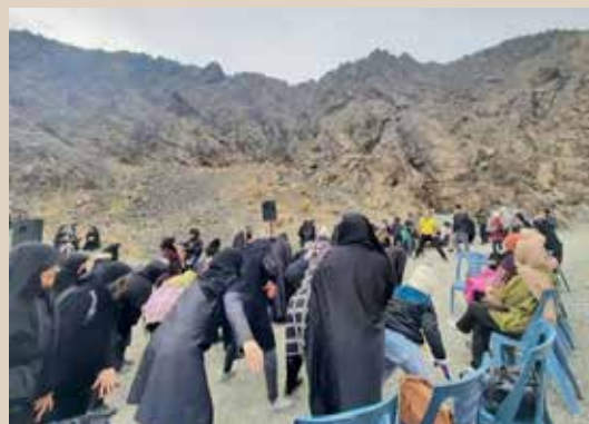
برگزاری کوه‌گشت خانوادگی در روستای جزه همراه با مراقبت تمامی گروه‌های سنی به همت شهرداری کاشان و اداره ورزش و جوانان و با همکاری بهروزان خانه بهداشت روستای خنب ● برگزاری آزمون‌های عملی و تئوری دانشجویان کاردانی بهورزی در شهرستان کاشان ● مراقبت و آموزش در مساجد و منازل ● شرکت بهروز جوادالائمه یزدل در المپیاد ورزشی کارکنان وزارت بهداشت ● برگزاری آزمون فصلنامه بهروز شماره ۱۲۰ و ۱۲۱