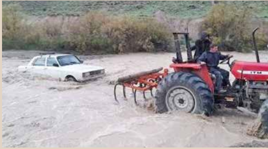
عبور بهورز دوآبی از رودخانه جهت خدمات رسانی به مناطق قمر و عشایر شهرستان درگز