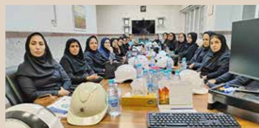
اجرای اردوی علمی آموزشی و بازدید از شرکت بابک مس ایرانیان به مناسبت روز بهورز