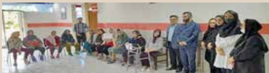
بازدید از سرای سالمندان