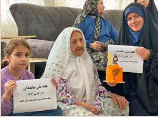
عیادت از مسن ترین سالمند شهرستان خمام