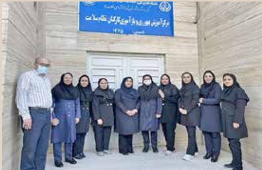
برگزاری دوره مهارت آموزی مربیان بهورزی جدید در مراکز آموزش بهورزی و بازآموزی کارکنان نظام سلامت دانشگاه