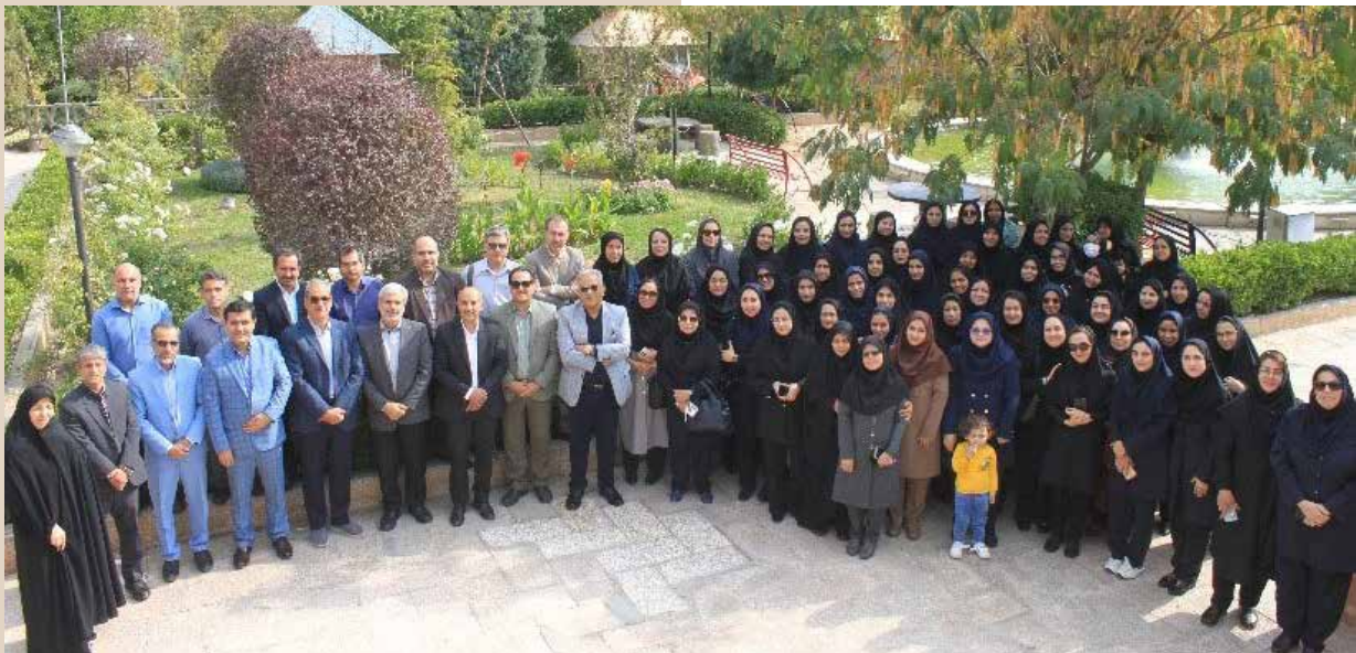
برگزاری گردهمایی مدیران، مربیان بهورزی و کارشناسان بهورزی دانشگاه علوم پزشکی مشهد در مجتمع فرهنگی بعثت به منظور قدردانی از زحمات این عزیزان