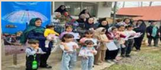
برگزاری مسابقه نقاشی به مناسبت هفته سالمندان