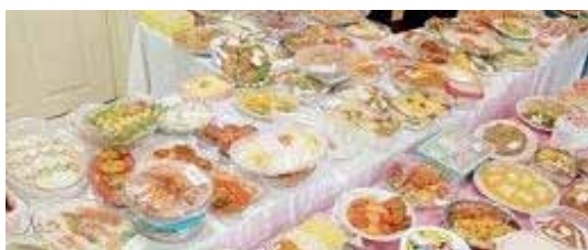
برگزاری جشنواره غذای سالم در مدارس و خانه‌های بهداشت، برگزاری برنامه‌های آموزشی به مناسبت پویش تغذیه با شعار «مصرف نمک کم و یددار» و «مصرف لبنیات کم چرب» و یدسنجی نمک مصرفی خانوار در خانه‌های بهداشت شهرستان سرخس