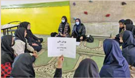
جلسه پویش ملی تست ای وی ونمونه گیری تست سریع توسط بهورزان و مراقبان سلامت