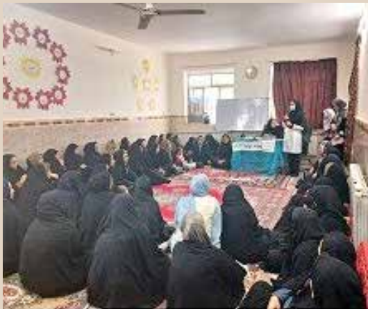
مشاوره فرزندآوری به مناسبت هفته سلامت بانوان در شهرستان سرخس