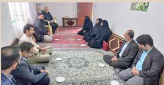
بازدید از پدر و مادر شهید به مناسبت هفته سالمند